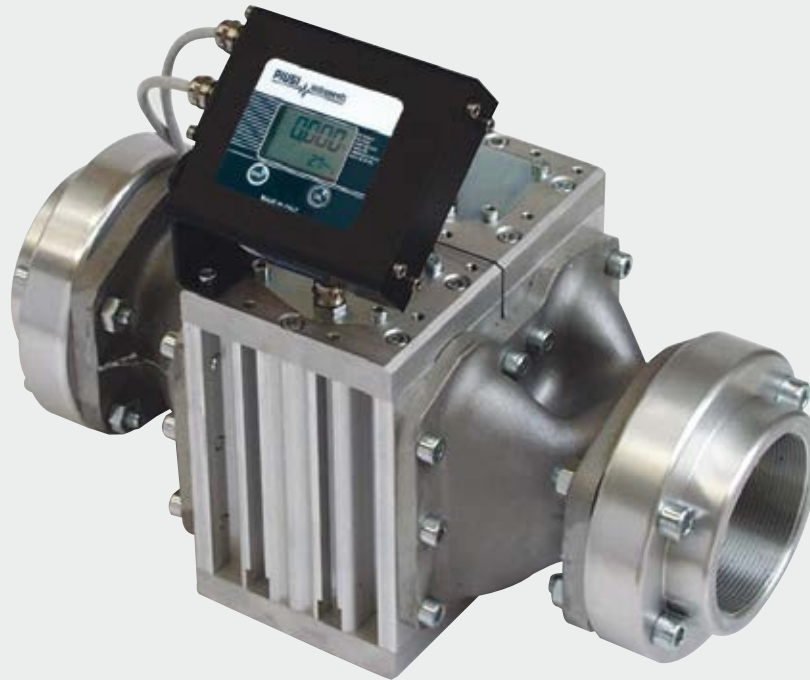
K900 / K900 PULSER