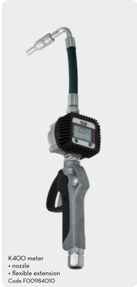
K400 meter + nozzle + flexible extension Code F00984010