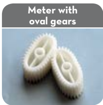
Meter with oval gears