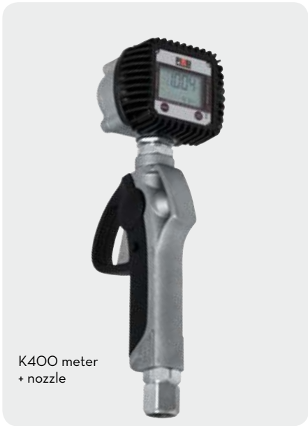
K400 meter + nozzle