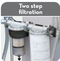
Two step filtration